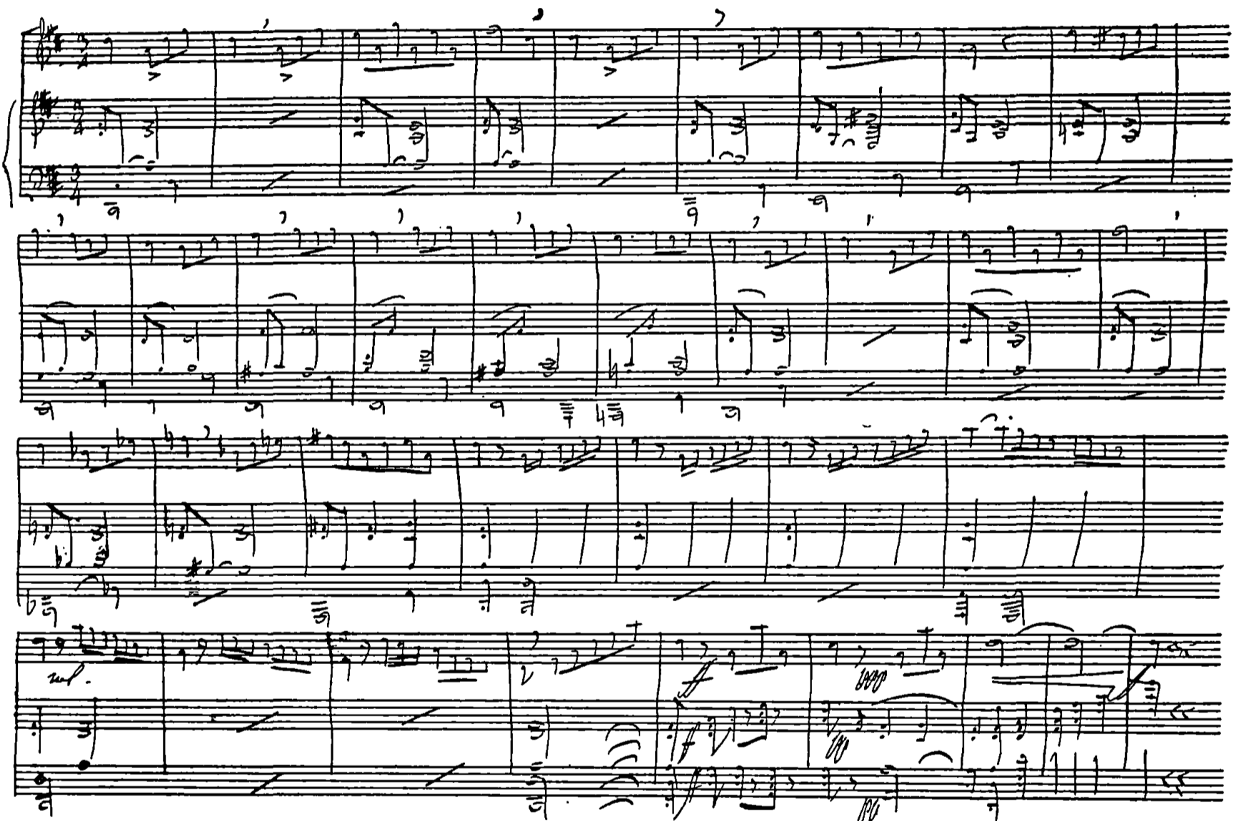
MANUSCRIT-AUTOGRAPHE D'ADOLPHE ADAM (Collection de M. Charles Malherbe)